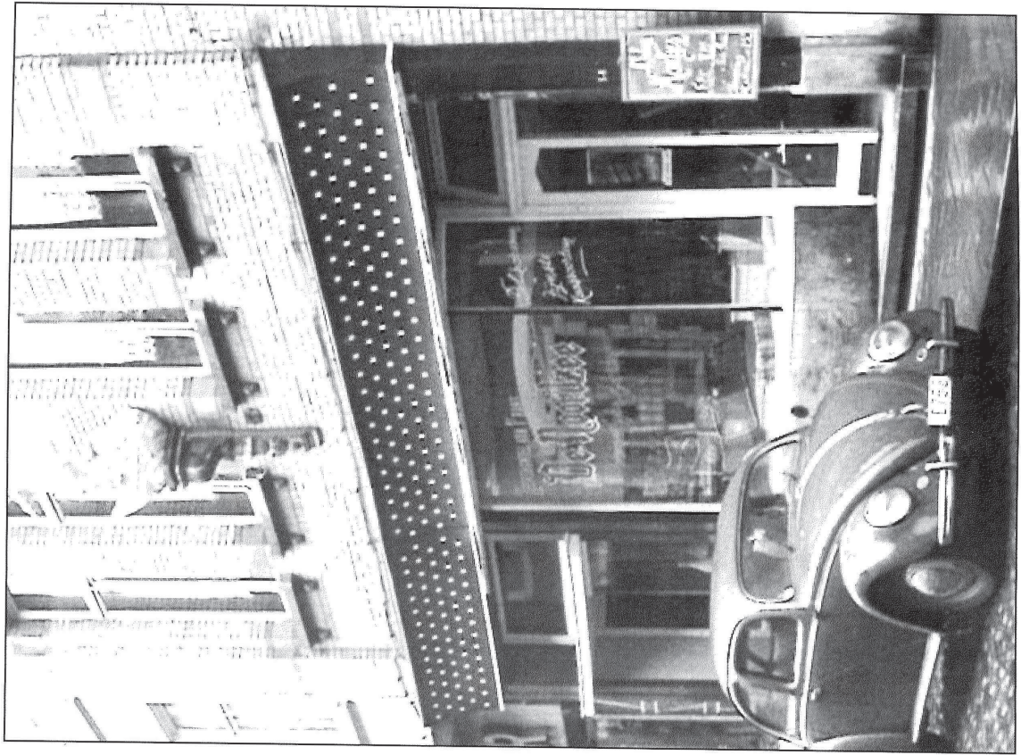
Cursiefjes in de originele spelling van de auteurs